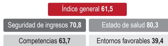
Figura 3. Resultado índice global de envejecimiento, aproximación metodológica de la Veeduría Distrital.