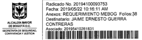
Ilustración 3. Memorando de la Secretaría Distrital de Seguridad, Convivencia y Justicia, contrato adquisición de motos año 2019

Frente a la expedición vía “fast track” de los estudios previos, se puede indicar que las entidades tenían conocimiento y que desde mayo de 2019 la MEBOG, venía solicitando el nuevo proceso de contratación, como se observa en oficio remitido por la Policía y en el memorando interno de la Secretaría Distrital de Seguridad, Convivencia y Justicia: