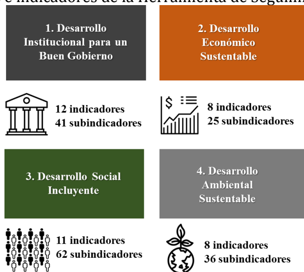
Figura 1. Ejes e indicadores de la Herramienta de Seguimiento Distrital