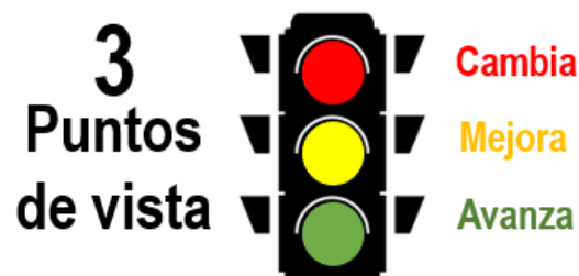
Figura 2. SemafORIZACIÓN de la Herramienta de Seguimiento Distrital