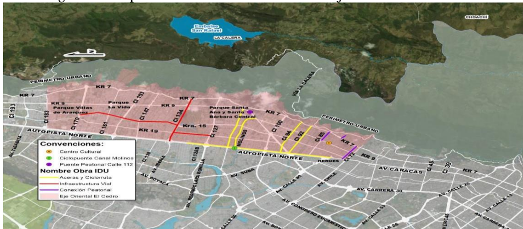
Figura 1. Mapa de localización de las obras Eje Oriental El Cedro