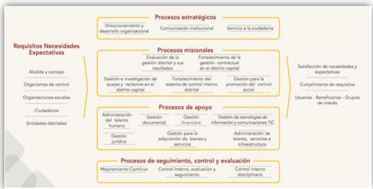
Ilustración 2. Mapa de Procesos 2020